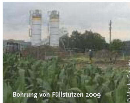
Bohrung von Füllstutzen 2009

Ernst Eichinger in einer schriftlichen Presseunterlage Anfang Juli 2009